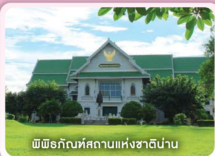
พิพิธภัณฑ์สถานแห่งชาติน่าน

- แหล่งท่องเที่ยวทางประวัติศาสตร์และศิลปวัฒนธรรม พิพิธภัณฑ์สถานแห่งชาติน่าน อนุสรณ์วีรกรรมพลเรือนตำรวจ ทหารทุ่งช้าง อนุสรณ์สถาน 17 ทหารกล้า (ฐานปฏิบัติการ บ้านห้วยโก๋นเก่า) ผ้าทอไทยลื้อ บ้านหนองบัว ภาพจิตรกรรม- วัดภูมินทร์