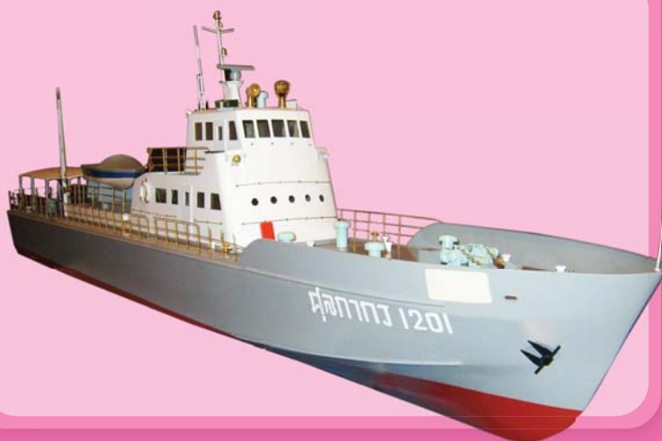
เรือจำลองศุลกากร