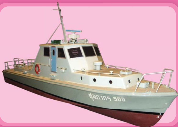
เรือจำลองศุลกากร