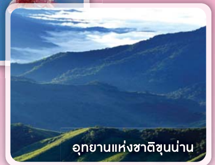
อุทยานแห่งชาติขุนน่าน