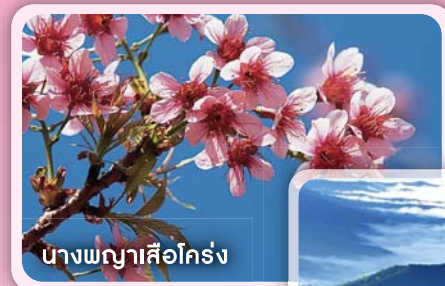
นางพญาเสือโคร่ง

- แหล่งท่องเที่ยวทางธรรมชาติ อุทยานแห่งชาติศรีน่าน อุทยานแห่งชาติขุนสถาน อุทยานแห่งชาตินันทบุรี อุทยาน- แห่งชาติดอยภูคา (ดอกชมพูภูคา) อุทยานแห่งชาติขุนน่าน อุทยานแห่งชาติแม่จริม (ล่องแก่งน้ำว้า) ผาฮู้ เสาดินน่าน้อย ดอยเสมอดาว บ่อน้ำพุร้อนบ้านน้ำทิพย์ จุดผ่านแดนห้วยโก๋น- น้ำเงิน บ่อเกลือสินเธาว์ภูเขามะตูมบ้านชาวประมงปากนาย บ้านมณีพลุกซ์ (ดอกเสี้ยวขาวและดอกนางพญาเสือโคร่ง)