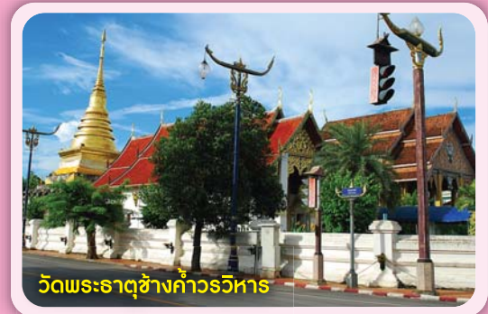
วัดพระธาตุช้างค้ำวรวิหาร

- แหล่งท่องเที่ยวทางศาสนา วัดพระธาตุแช่แห้ง วัดภูมินทร์ วัดพระธาตุช้างค้ำวรวิหาร วัดสวนตาล วัดพระธาตุเขาน้อย วัดมิ่งเมือง วัดหนองบัว วัดหนองแดง