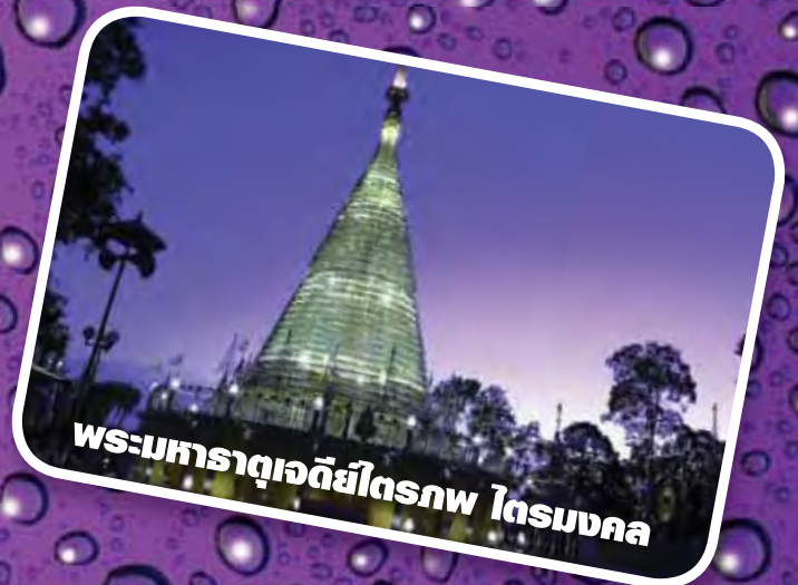
พระมหาธาตุเจดีย์ไตรภพ ไตรมงคล