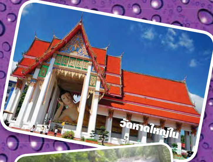
วัดหาดใหญ่ใน