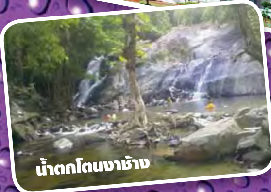
น้ำตกโดนงาช้าง

ด้านศุลกากรท่าอากาศยานหาดใหญ่ อ.คลองหอยโข่ง จ.สงขลา 90115