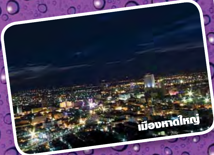
เมืองหาดใหญ่