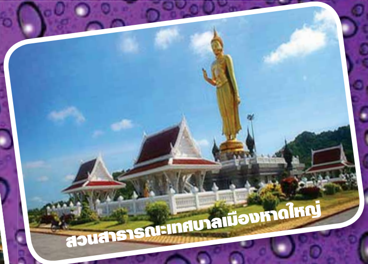
สวนสาธารณะเทศบาลเมืองหาดใหญ่