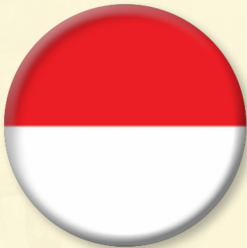
(Republic of Indonesia)