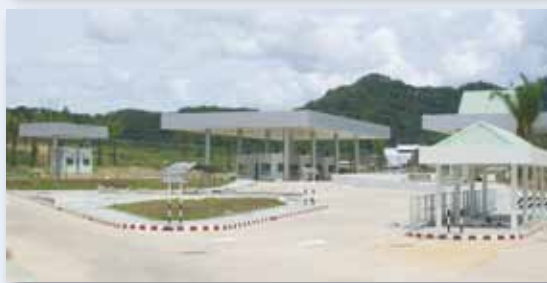
ที่มา : ด่านศุลกากรบ้านประกอบ / ด่านศุลกากรสะเดา