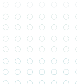
ด้านศุลกากรตามที่ ร.มว.คลัง ประกาศกำหนด 45 ด้าน