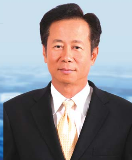
นายอุทิศ ธรรมวาทีน อธิบดีกรมศุลกากร