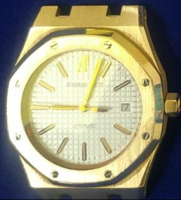
รายการที่ 3