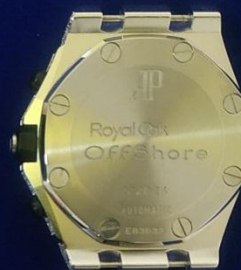
รายการที่ 2