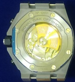
รายการที่ 1