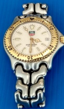
รายการที่ 5