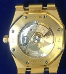
รายการที่ 3