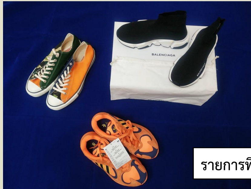
รายการที่ 8-10