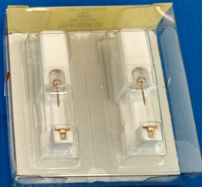
รายการที่ 1