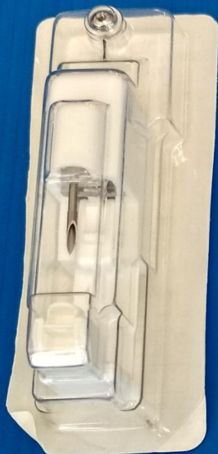
รายการที่ 2