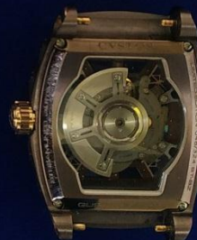
รายการที่ 4