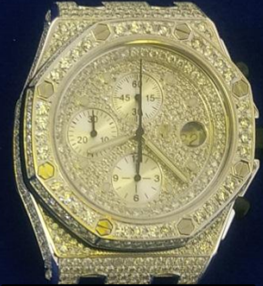
รายการที่ 2