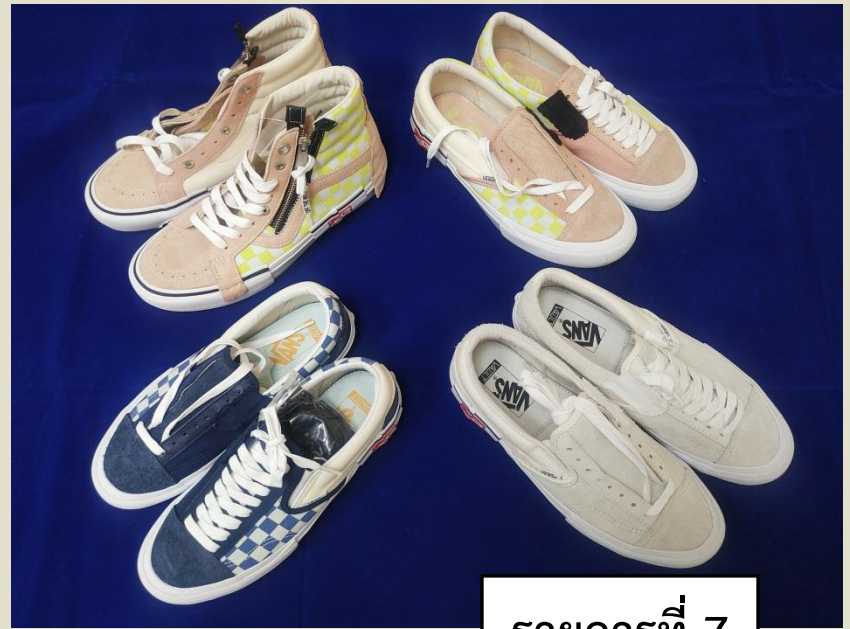
รายการที่ 7