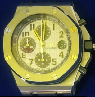
รายการที่ 1