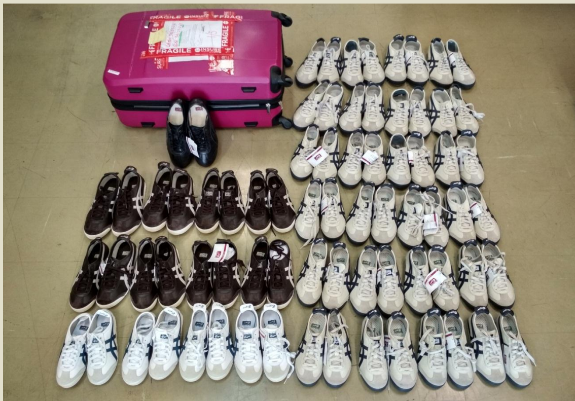
รายการที่ 1-2