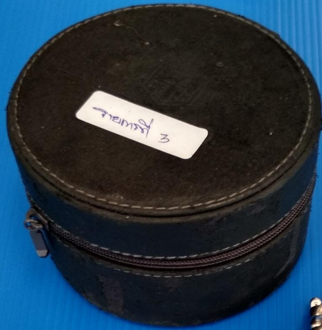
รายการที่ 3