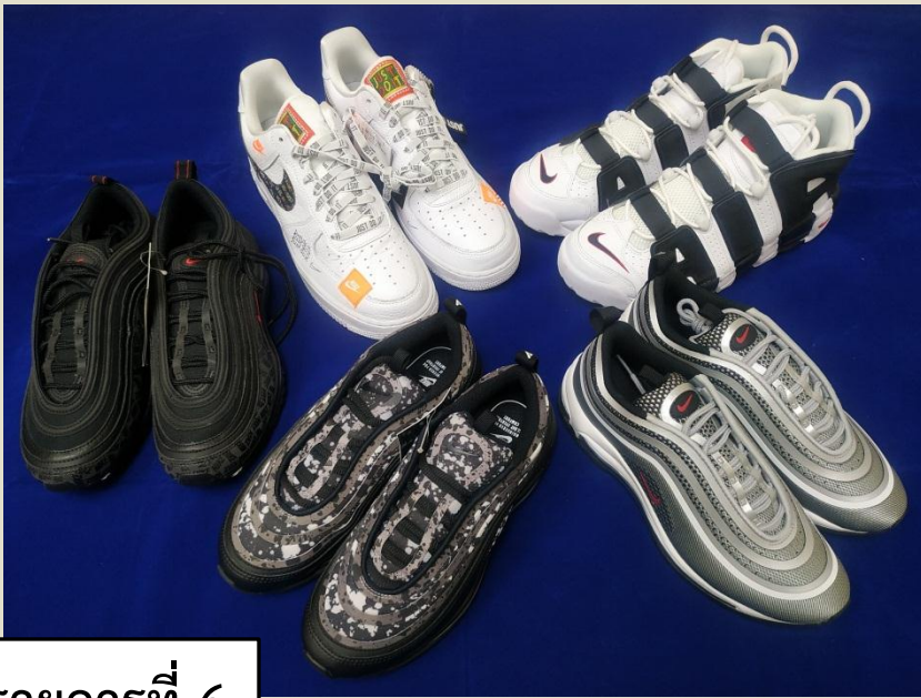
รายการที่ 6