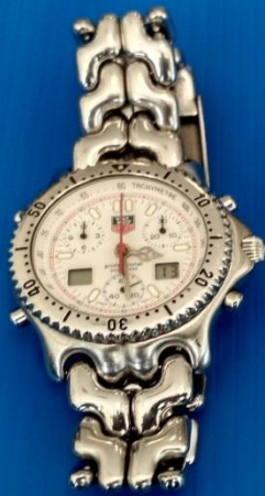
รายการที่ 4