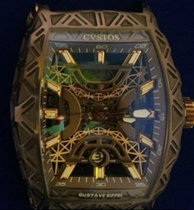
รายการที่ 4