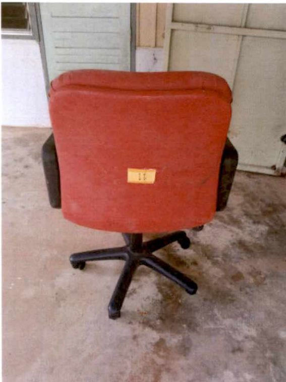
พัสดุรายการที่ ๑๑