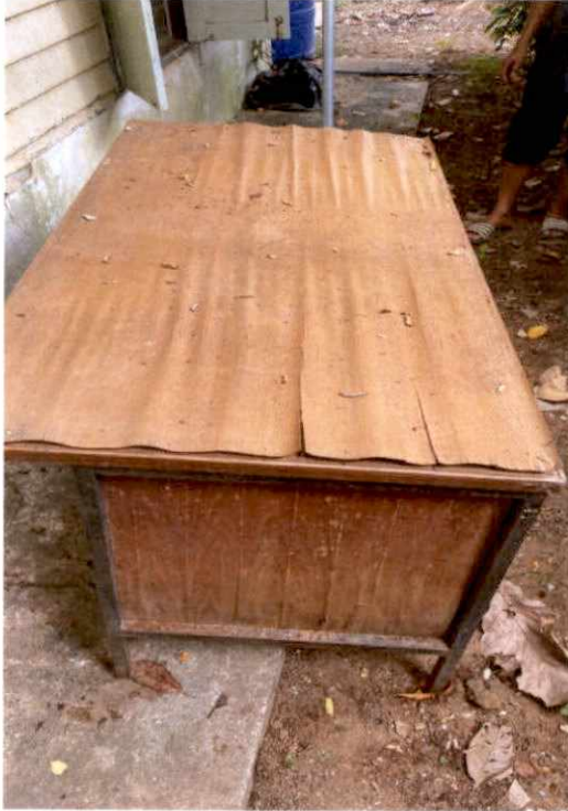
พัสดุรายการที่ ๑