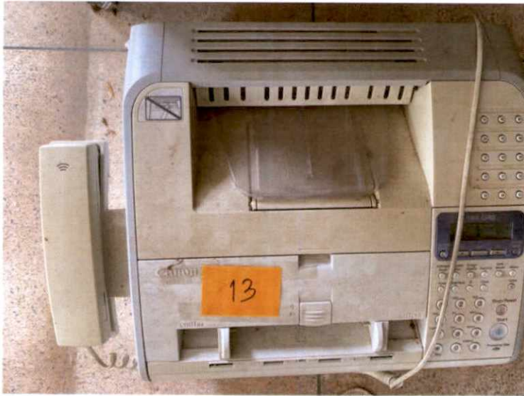
พัสดุรายการที่ ๑๓