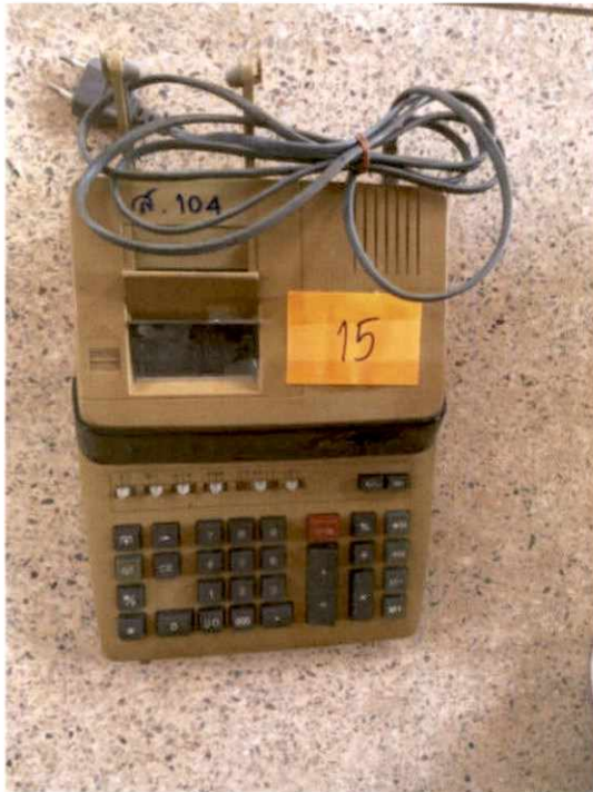
พัสดุรายการที่ ๑๕