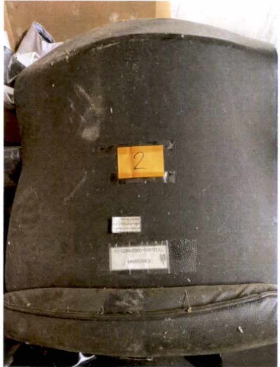
พัสดุรายการที่ ๒