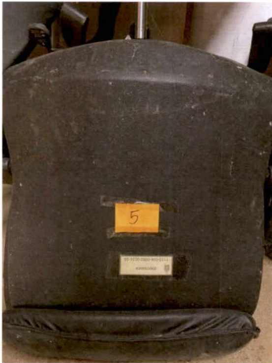
พัสดุรายการที่ ๕