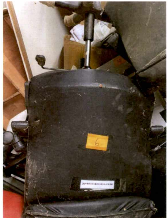
พัสดุรายการที่ ๖