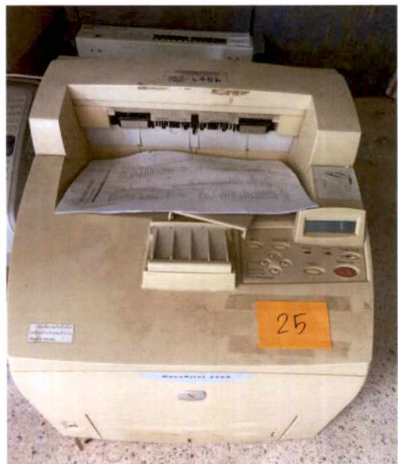
พัสดุรายการที่ ๒๓