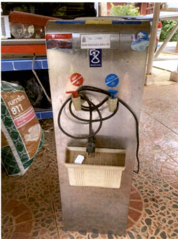
พัสดุรายการที่ ๒๑