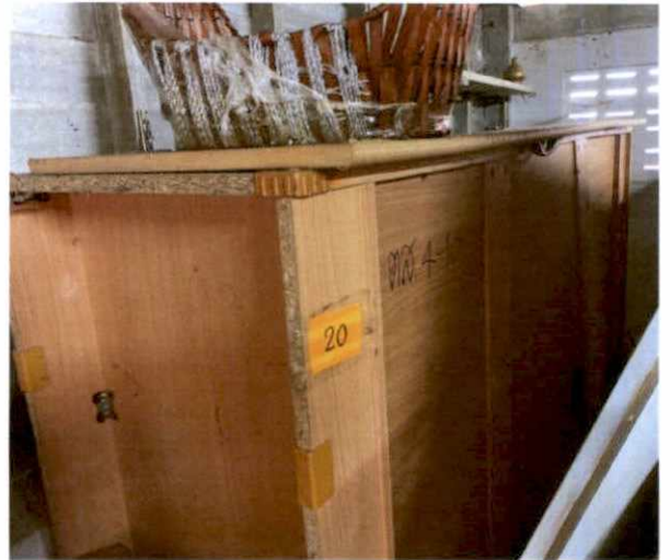
พัสดุรายการที่ ๒๐