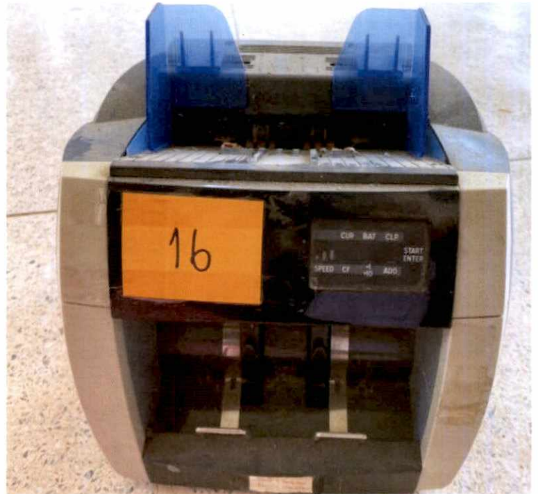
พัสดุรายการที่ ๑๖