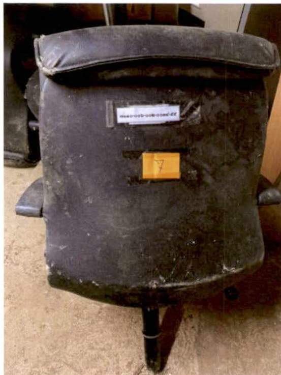
พัสดุรายการที่ ๗