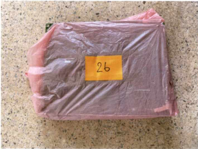
พัสดุรายการที่ ๒๔