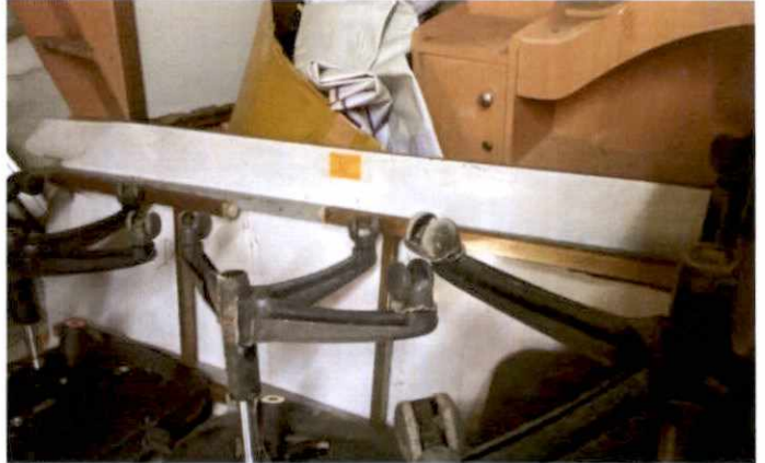
พัสดุรายการที่ ๑๐