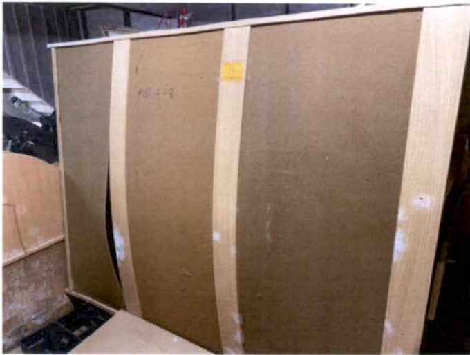
พัสดุรายการที่ ๑๙