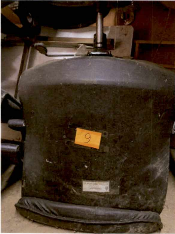
พัสดุรายการที่ ๙