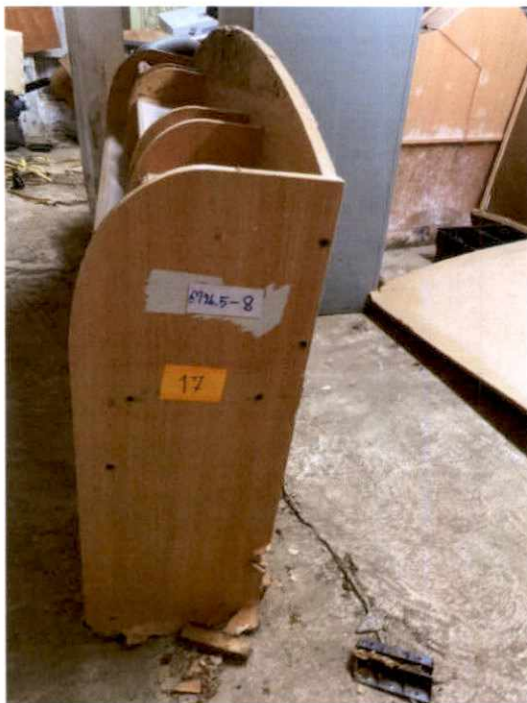
พัสดุรายการที่ ๑๗