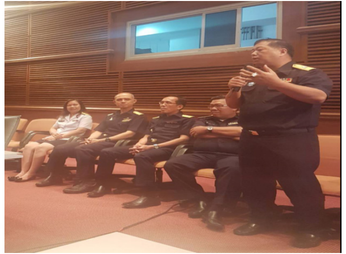
รูปภาพการสัมมนาพบผู้ประกอบการด้านสิทธิประโยชน์ ครั้งที่ ๒ เมื่อวันที่ ๑ กันยายน ๒๕๖๐ ณ สำนักงานศุลกากรท่าเรือแหลมฉบัง

ผู้ประกอบการในเขตปลอดอากร ดังนั้นเพื่อเป็นการ ดำเนินการตามกรอบความตกลงว่าด้วยการอำนวยความสะดวก ทางการค้า รวมถึงพันธกิจและยุทธศาสตร์ของ กรมฯ เพื่ออำนวยความสะดวกผู้ประกอบการในการลดขั้นตอน การปฏิบัติพิธีการทางศุลกากรและสอดคล้องกับกระบวนการ ผลิตของบริษัทที่ใช้วิธีการจัดส่งวัตถุดิบหรือชิ้นส่วนตาม แผนการผลิตทุกวัน ตามจำนวนเที่ยวและเวลาที่กำหนด (Just in time) และเพื่อลดขั้นตอนและเพิ่มประสิทธิภาพในการ ทำงานด้านเอกสารที่ใช้ในการผ่านพิธีการศุลกากร ผู้เขียนจึง ได้ผลักดันบริษัทที่ประกอบกิจการในเขตปลอดอากร และที่ อยู่ภายใต้การควบคุมของ สำนักงานศุลกากรท่าเรือแหลมฉบัง (สทบ.) ให้มีการจัดทำขออนุมัติหลักการจัดทำใบขนสินค้า ขาออกโอนย้ายเข้าเขตปลอดอากร “ประเภท D” โดยใช้ข้อมูล การส่งวัตถุดิบล่วงหน้า 10 วัน (10 days) อาทิ บริษัท สยามคูโบต้าคอร์ปอเรชั่น จำกัด บริษัท มิตรชัย มอเตอร์ (ประเทศไทย) จำกัด และบริษัท เอสเอไอซี มอเตอร์ ซีพี จำกัด เป็นต้น ซึ่งหลักการ 10 days คือ การใช้ข้อมูล การส่งชื่อวัตถุดิบหรือชิ้นส่วนจากผู้ประกอบการในประเทศ ล่วงหน้า ๑๐ วัน เป็นข้อมูลเพื่อสำแดงรายการในใบขนสินค้า ขาออกโอนย้ายเข้าเขตปลอดอากร “ประเภท D” จำนวน ๑ ฉบับต่อการนำของเข้าไปในเขตปลอดอากรในช่วงเวลา ๑๐ วัน โดยแบ่งเป็น ๓ ช่วงเวลาของเดือน คือ วันที่ ๑ - ๑๐ วัน ที่ ๑๑ - ๒๐ และวันที่ ๒๑ - สิ้นเดือน โดยมีการผ่อนผันใน ภายหลัง เพื่อใช้เป็นเอกสารประกอบการตรวจปล่อยสินค้าดัง กล่าวจะเข้าไปในเขตปลอดอากรในลักษณะบางส่วน (Partly) และให้ถือว่าของนั้นได้ส่งออกสำเร็จในวันและเวลาสุดท้ายที่