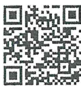
สิ่งที่ส่งมาด้วย ๓