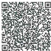
สิ่งที่ส่งมาด้วย ๑

กองระบบการคลังภาครัฐ กลุ่มงานบริการและประชาสัมพันธ์ โทรศัพท์ ๐ ๒๐๓๒ ๒๖๓๖ และ ๐ ๒๒๙๘ ๖๖๖๐ ไปรษณีย์อิเล็กทรอนิกส์ gfmis1@cgd.go.th